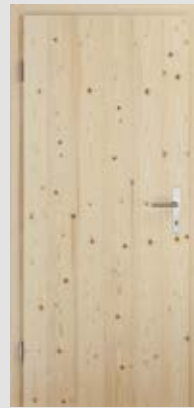
Modell 1: Türblatt in Fichte astig roh